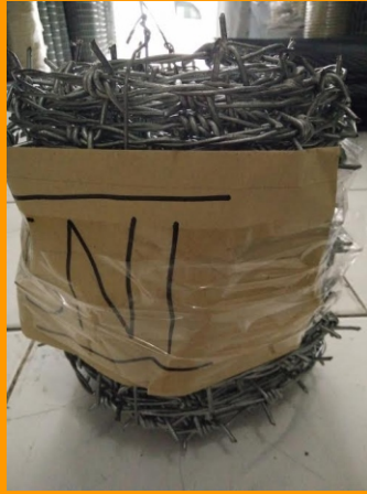
Kawat Duri SNI