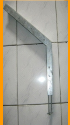
Tiang Tekuk KD