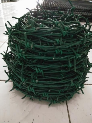
Kawat Duri PVC